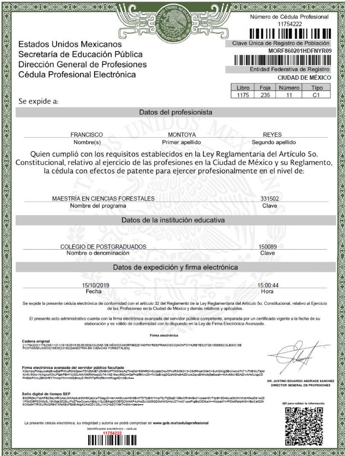
Figura XV—3. Cédula profesional de maestría en Ciencias Forestales del responsable de dirigir la ejecución del cambio de uso de suelo