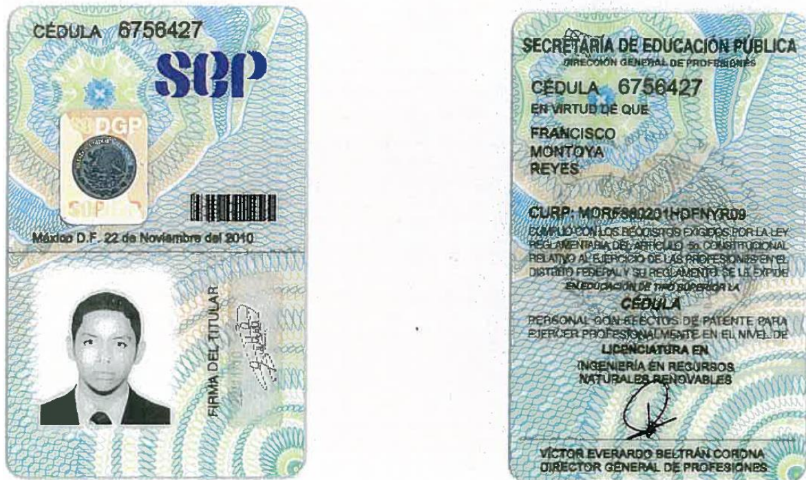
Figura XV—2. Cédula profesional de Licenciatura en ingeniería en recursos naturales renovables del responsable de dirigir la ejecución del cambio de uso de suelo